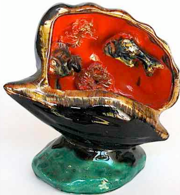
Lampe Coquillage - Vallauris

D'autres souvenirs de vacances ont fait les beaux jours des boutiques à touristes et certains de ces objets passés de mode comme les lampes coquillage, séduisent les collectionneurs d'aujourd'hui. Les uns les trouvent atroces, les autres en raffolent : Parce qu'elles sont terriblement kitsch, ces lampes coquillage des années 50 et 60 ! Une coque ouverte en céramique colorée, le tout décoré tel un aquarium, d'étoiles et d'hippocampes, parfois même de sirènes ! Voici posé le décor que vient compléter une petite ampoule lumineuse. Ces coquillages au goût décrié servaient de veilleuse pour les chambres d'enfants, ou pour créer une douce ambiance. À cette époque dans les années soixante, les fabriques à souvenirs du village de Vallauris en étaient passées maîtres. Avec le temps, on les trouverait presque belles, sinon attachantes ses drôles de lampes venues de la mer.