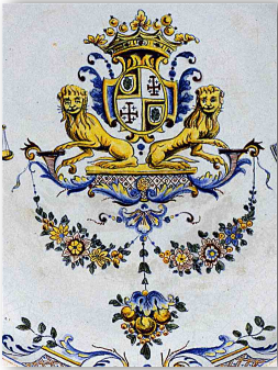
Plat Hustin 1720 (Décor)