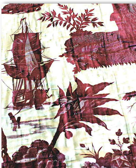
Toile de Beautiran