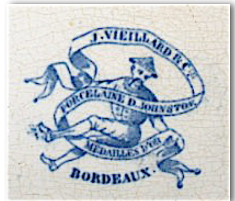
Marque de fabrique : Vieillard