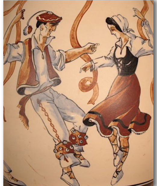
Vase Ciboure - Le Corrone - détail

À Ciboure, petit port des Pyrénées-Atlantiques débute au XXe siècle la fabrique de poteries du même nom. Des milliers de pièces peintes de scènes locales dans les bruns et les fauves y ont été fabriquées. Jugées aussi précieuses à l'époque qu'aujourd'hui des boules-de-neige en plastique, elles n'ont pas toujours reçu l'égard qu'elles méritaient. Combien ont disparu au fond d'une cave, combien se sont ébréchées dans un déménagement? Personne n'en sait rien. Seule certitude, aujourd'hui; leurs décors peints et raffinés enchantent le monde. Ces poteries en grès que l'on posait jadis sur un coin de cheminée jouissent désormais de toutes les bienveillances. Leur prix a flambé et leurs collectionneurs ne jurent que par Le Corrone et Floutier, deux artistes peintres qui en ont signé les décors. Les amateurs de poteries de Ciboure recherchent très souvent les poteries Gaïtaud d'un style voisin, elles aussi sont basques.