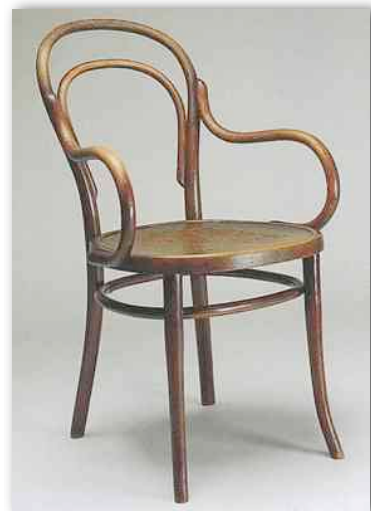
Chaise Thonet Modèle 14