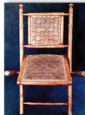
Fauteuil colonial 1930 en bambou

Quelques ébénistes célèbres l'utiliseront pour la confection de meubles tendance comme Louis Sognot (1892-1970) à la fin des années 50.